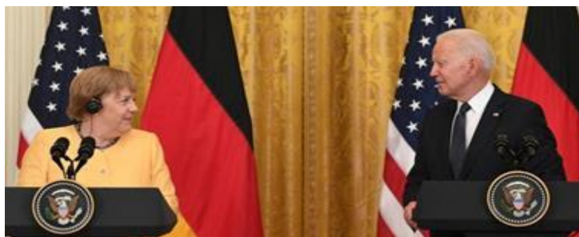
Thủ tướng Đức Angela Merkel và tổng thống Mỹ Joe Biden năm 2021