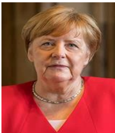
Nữ thủ tướng Đức Angela Merkle 2019

Năm 1973, Angela Dorothea Kasner đậu tú tài với số điểm 1,0 (tối ưu). Bà nói thông thạo hai thứ tiếng Anh và Nga. Là con người say mê khoa học, bà ghi tên học về vật lý ở đại học Leipzig và lấy bằng tiến sĩ về vật lý năm 1986. Vào những năm 70 bà xin làm việc ở Đại học Bách khoa Ilmenau, theo như lời bà kể, mật vụ Stasi của cộng sản đông Đức muốn tuyển mộ bà làm việc cho họ, nhưng bà từ chối. Chính vì thế bà không được nhận làm việc cho trường đại học.