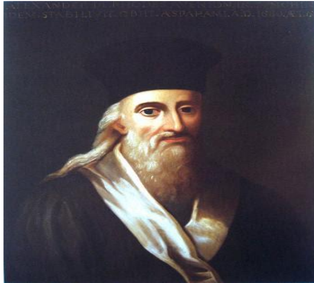
Alexandre De Rhodes (1591-1660)