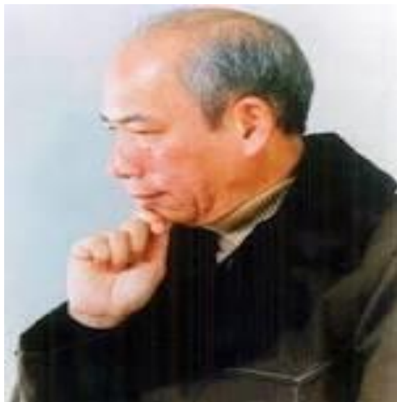
GS/Triết gia KIM ĐỊNH

( Bài phê bình này đã in làm hai kỳ trên báo “Văn Nghệ” cách nay 22 năm. Kỳ này chỉ in lại phần một trên “Văn Nghệ” số 17 ra ngày 27- 4-1996) GS. triết gia, linh mục Lương Kim Định ( 1914-1997)