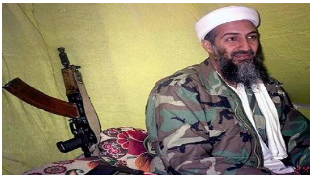
Trùm khủng bố Osama bin Laden .

"Khalid, tới đây", một đặc nhiệm SEAL nói thảm bằng tiếng Ả Rập. Ngay khi Khalid vừa lộ đầu ra để xem ai đang nói, con trai trùm khủng bố bị trúng phát đạn vào mặt.