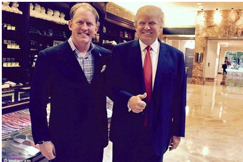
Cựu đặc nhiệm SEAL Robert O'Neill chụp ảnh cùng Tổng thống Mỹ Donald Trump .

Đặc nhiệm SEAL tự nhận mình là người bắn trùm khủng bố Osama bin Laden, mới đây đã ra cuốn sách tiết lộ chi tiết những gì xảy ra trong cuộc đột kích 6 năm trước.