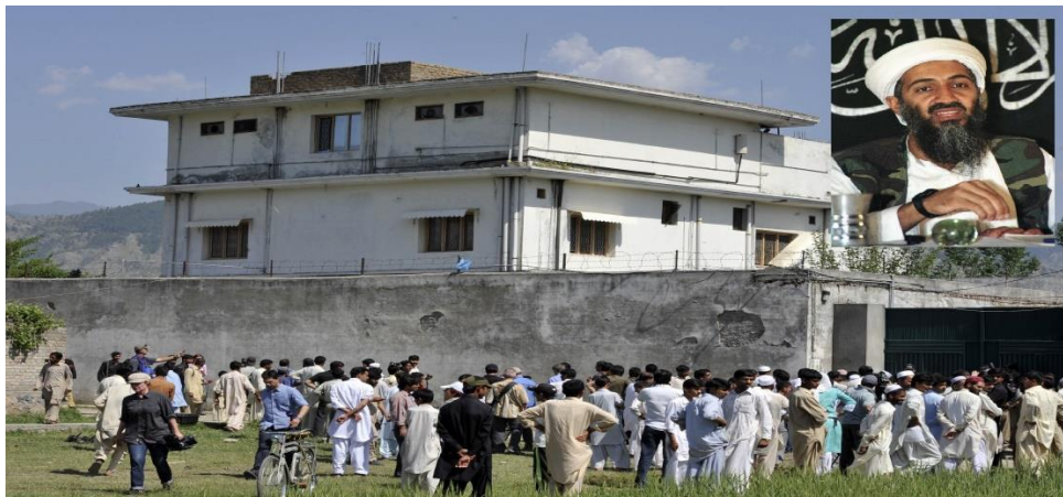
Nơi ẩn náu của trùm khủng bố Osama bin Laden

Một trong những manh mối giúp lực lượng tình báo Mỹ xác định nơi ẩn náu của trùm khủng bố Osama bin Laden là vì các bà vợ của ông ta phơi quá nhiều quần áo.