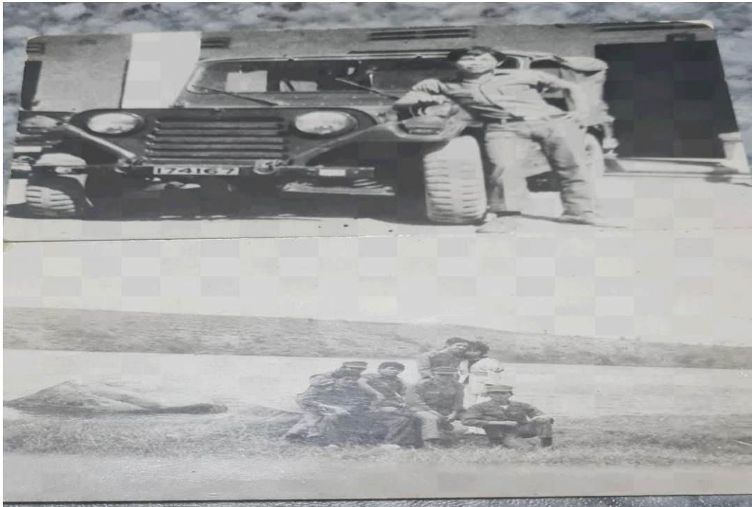
Bên Biển Hồ, một thằng vừa mới tình nguyện chết trong tay Ma nữ Chợ mới Pleiku