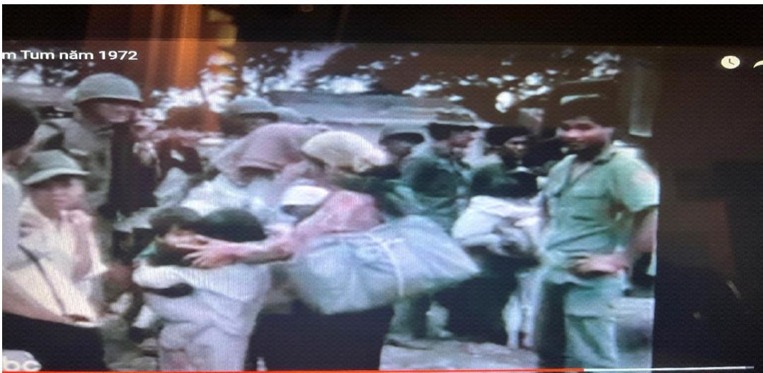
Di tản dân quân về Pleiku, Xuân Chinook đang chờ Chinook đáp xuống sân Vận Động Kon Tum Nguồn BBC Australia 1972

Kính mời đọc thêm những truyện khác của tác giả tại: http://www.vietnamvanhien.org/PhanNhatBac.html