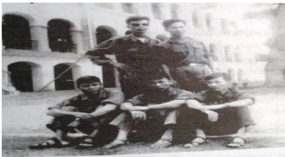
Ban Chỉ huy Trung Đoàn 2 Sư Đoàn 3 Sao Vàng Bắc Việt tại Trường TSQ Vũng Tàu ngày 30 tháng 4 lúc 2,30 chiều ,sau khi bị ăn đạn của TSQ