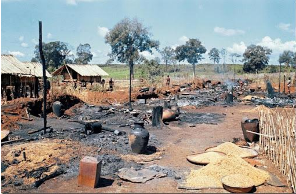
Ấp tân sinh Đắc Sơn bị VC dùng súng phun lửa hủy diệt, giết 114 dân làng và làm bị thương 47 người

Ngày 8 tháng 11, 1967: Trung tâm tị nạn Kỳ Chánh tỉnh Quảng Tín bị VC xâm nhập giết chết 4, làm bị thương 9 và bắt đi 9 người khác, lớp học bị đốt.