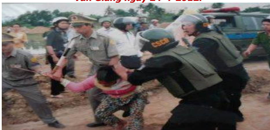
Một đám công an khác đang nắm đầu đánh một phụ nữ ở Văn Giang ngày 24-4-2012.