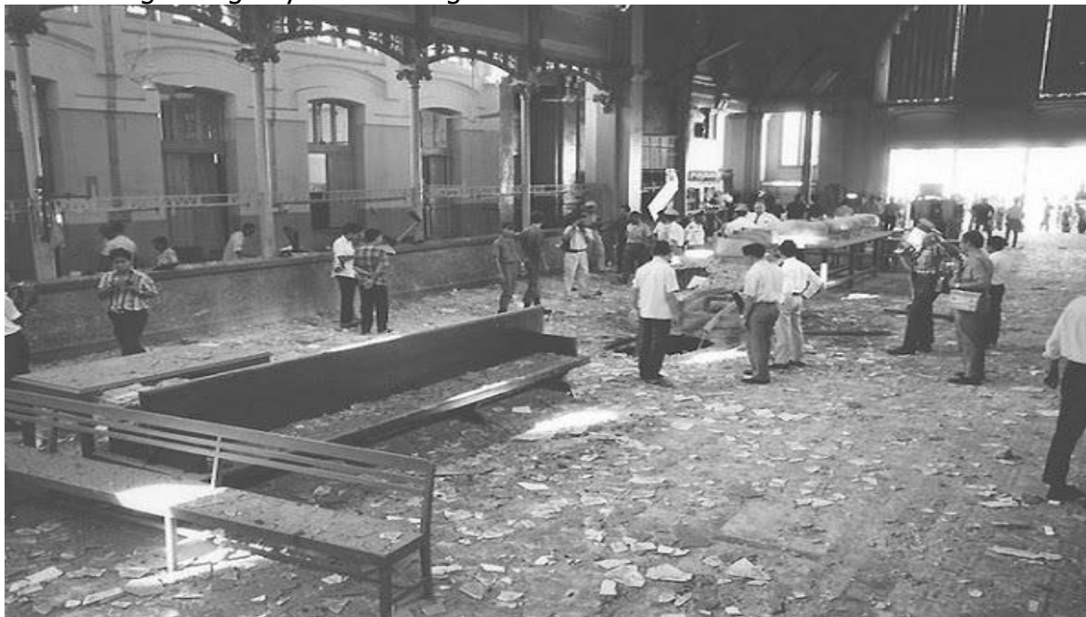
Cảnh đổ nát bên trong Bưu Điện Sài Gòn do VC đặt bom ngày 8-5-1969.

Ngày 6 tháng 5, 1969: VC bắt cóc và giết ông Lê Văn Giáo 37 tuổi ở làng Vĩnh Phú tỉnh An Giang vì ông này từ chối đóng thuế cho VC.