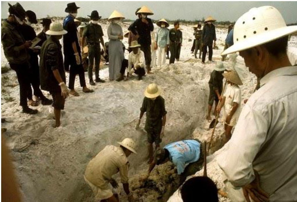
Một cuộc khai quật mồ chôn tập thể thăm sát Mậu Thân Huế

Ngày 20 tháng 1, 1968: Một toán du kích VC có vũ trang cường bức khoảng 100 dân cư quận Tam Quan tỉnh Bình Định tập họp để nghe chúng tuyên truyền. Một người lớn tuổi lên tiếng phản đối liền bị VC bắn chết.