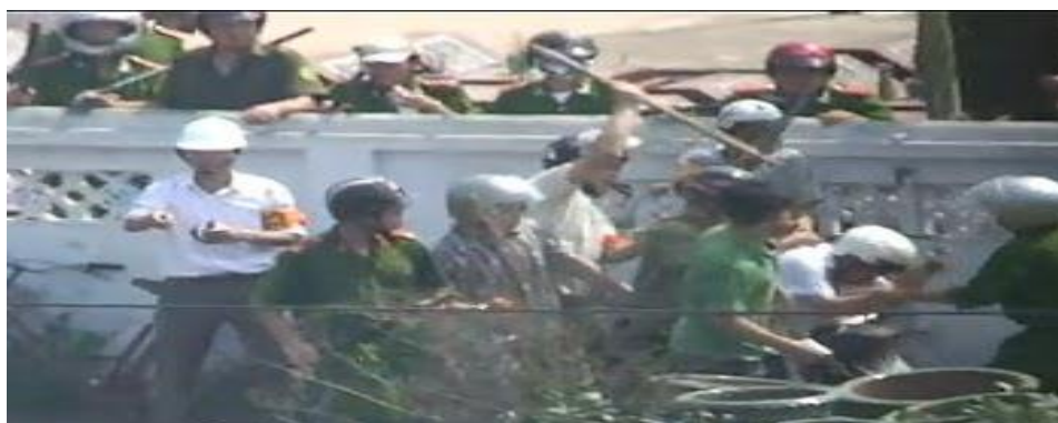
Một đám công an mặc sắc phục lần thường phục đang đánh một người dân ở Văn Giang ngày 24-4-2012.

“Chính quyền huyện Văn Giang, tỉnh Hưng Yên, đã huy động lực lượng hùng hậu gồm hàng ngàn cảnh sát cưỡng chế các nông dân kiên quyết bám trụ không giao đất để xây dựng khu đô thị thương mại-du lịch Ecopark. Một số hình ảnh video được đưa lên mạng sau đó cho thấy đã có hành động bạo lực mạnh tay của lực lượng cưỡng chế đối với những người nông dân phản kháng. Trong một video gần 10 cảnh sát và những người mặc thường phục đeo băng đỏ đã xông vào dùng dùi cui và tay chân đánh hội đồng một nông dân không vũ khí. Sau đó có nhiều tiếng ồn ào và có tiếng nổ.”