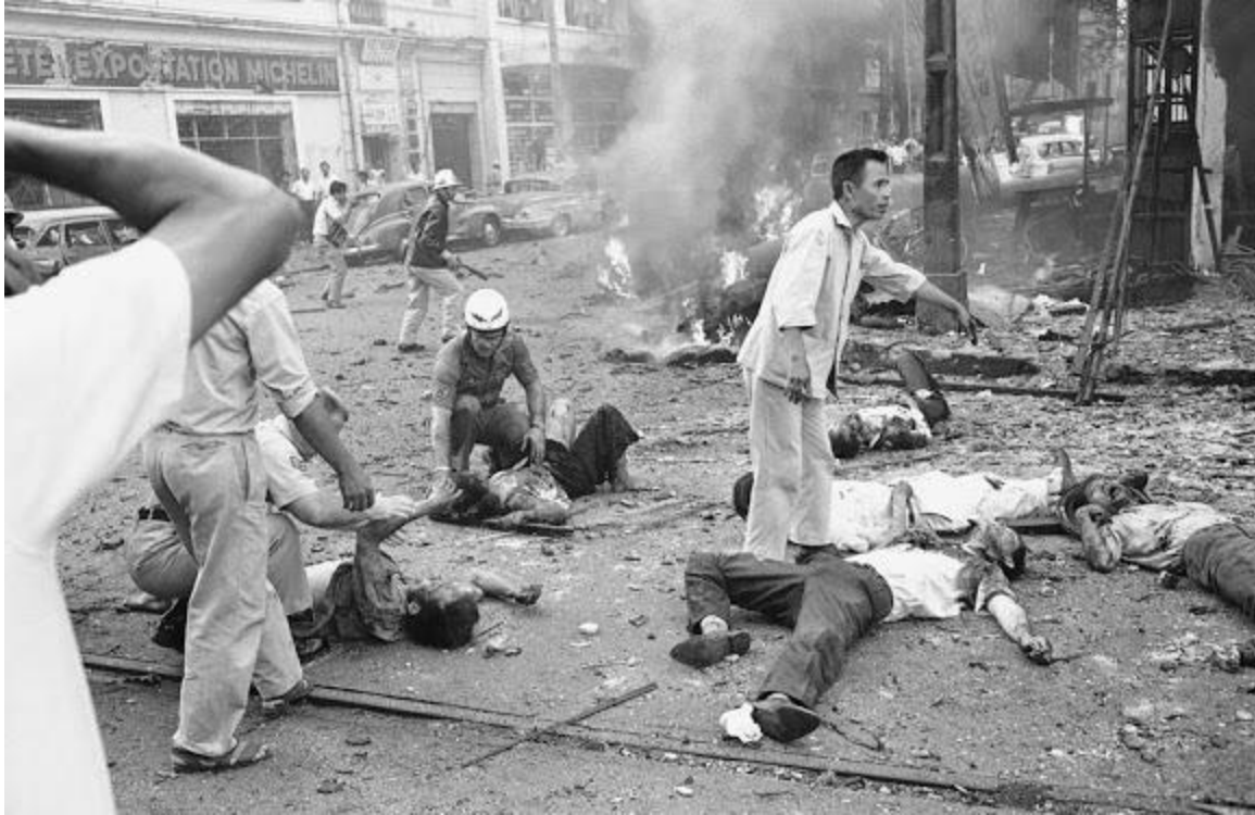
Quang cảnh bên ngoài Tòa Đại Sứ Mỹ cũ trên đại lộ Hàm Nghi trong vụ VC khủng bố ngày 30/3/1965.

Ngày 6 tháng Hai 1965: Đài phát thanh VC cho biết VC đã đem hai tù binh người Mỹ ra bắn chết để trả thù cho 2 khủng bố VC vừa bị VNCH xử bắn.