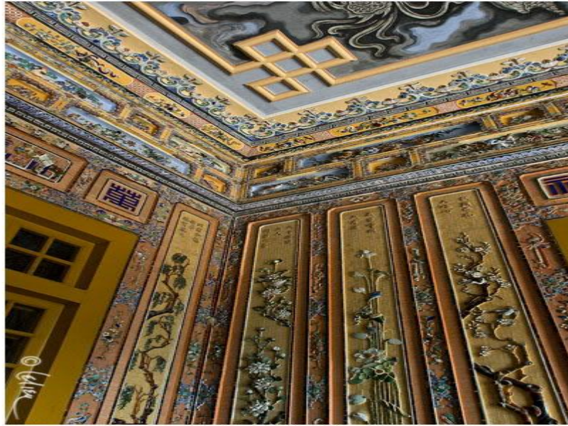
Lăng Khải Định, Huế, Vietnam - '07