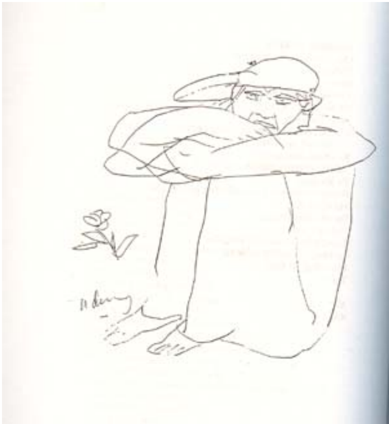
Phụ bản Ngọc Dũng