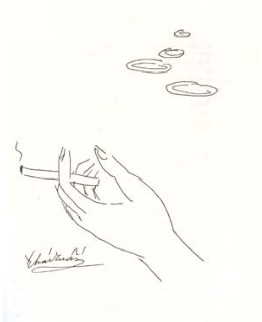
Phụ bản Thái Tuấn